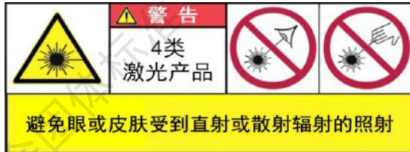
图 3 4 类激光产品警告标记