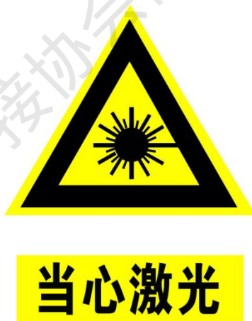
图 1 激光警示标记